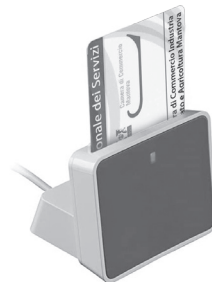
Lettore uTrust 2700 R con base