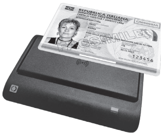
Lettore Carta d'Identità Elettronica 3.0 (CIE)